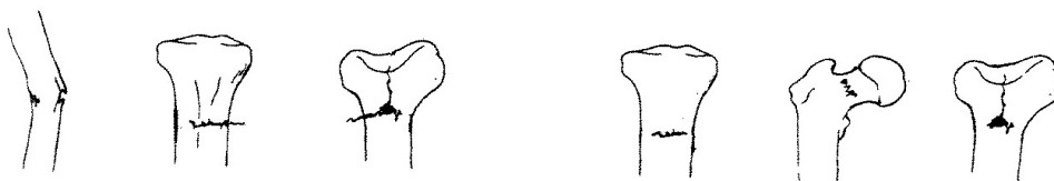
（不完全骨折，共 3 種範例）